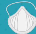
Mascarilla o barbijo